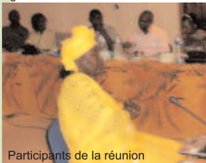
Participants de la réunion

En tant que cadre de suivi et d'évaluation du programme, un tel exercice sera mené chaque six mois en vue de permettre une bonne gestion du programme.