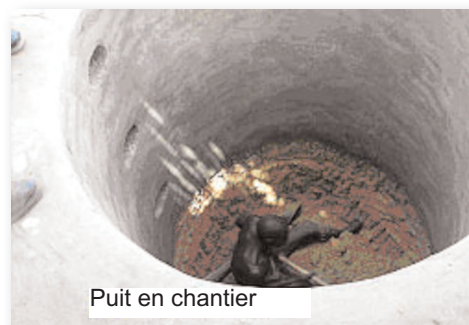
Puit en chantier

Grâce à cette action, le village d'Adéana devrait bientôt pouvoir disposer de l'eau potable par le fonçage d'un puits.