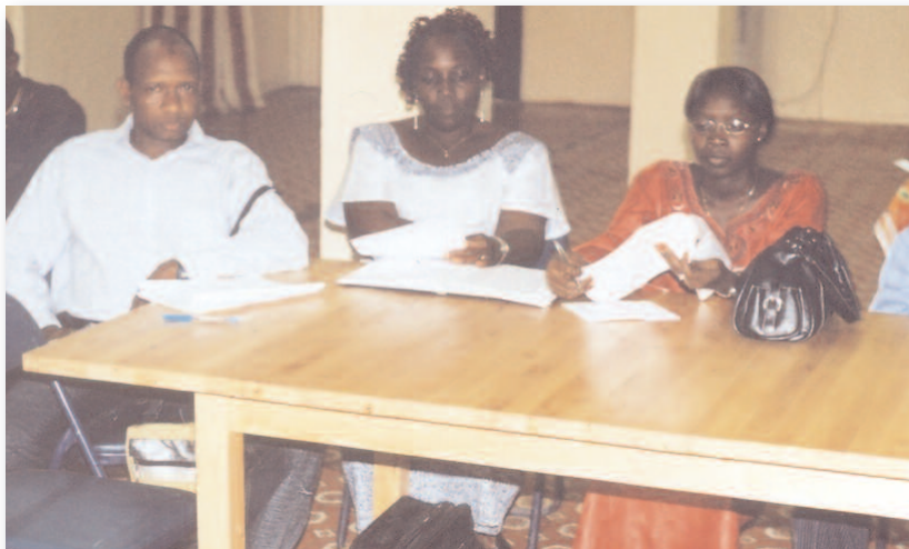
Participants de l'atelier sur les FDF

OXFAM GB, avec le financement de l'Agence Suédoise pour la Coopération Internationale et le Développement (SIDA), soutient les émissions radiophoniques du WANEP dans les pays riverains du Fleuve Mano sur 3 années successives (2006 – 2008). Dans le cadre du processus de mise en œuvre du programme, WANEP-Guinée a tenu une Réunion de planification stratégique de deux jours et un atelier de Formation des Formateurs de trois jours sur l'édification de la paix pour les groupements féminins en Guinée Conakry du 6 au 10 février 2007. La planification stratégique et l'atelier de formation des formateurs ont donné le coup d'envoi de ces activités qui visent à étendre le programme du Réseau Femme dans l'Édification de la Paix (WIPNET) à la Guinée. Les activités étaient organisées de sorte à développer un puissant mouvement féminin transfrontalier pour le plaidoyer en faveur de la paix dans le bassin de l'Union du Fleuve Mano, capable d'influencer et de concrétiser les Politiques nationales et régionales. Les résultats tangibles suivants ont été obtenus, par activité: