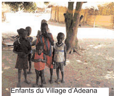
Enfants du Village d'Adéana

La vie a repris à Adéana, un village situé dans la communauté rurale de Djibanar (Casamance, Sénégal). Plus de quinze ans après l'exode provoqué par les attaques des bandes armées, plusieurs familles ont franchi la frontière entre le Sénégal et la