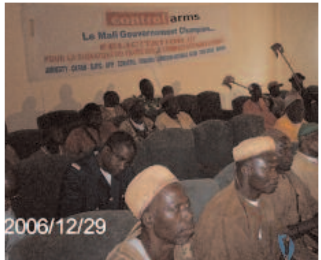
Une vue des Participants de la cérémonie de lancement

Le lancement officiel dudit projet qui a eu lieu en Janvier dernier, a enregistré la participation massive de tous les élus